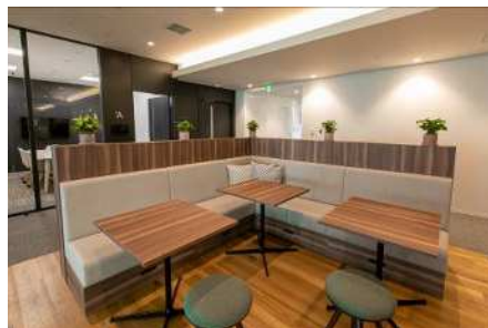
インタラクティブエリア