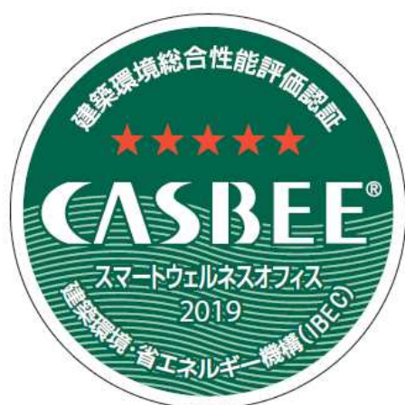
CASBEE-スマートウェルネスオフィス認証 評価認定票

京急電鉄では，今後も働きやすいオフィス環境の推進を行ってまいります。 詳細は別紙のとおりです。