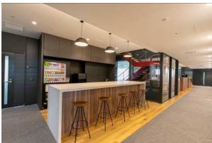
手前：パントリー 奥：内部階段