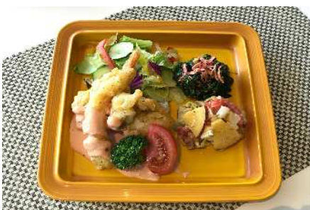
カフェテリアのヘルシーメニュー（一例）