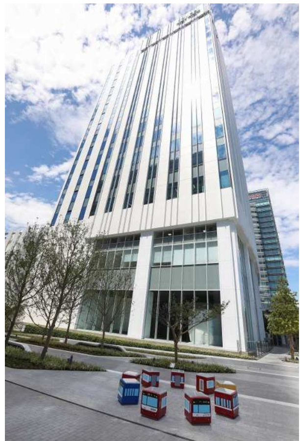
「京急グループ本社」外観