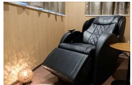
リラックスルーム