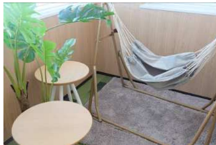
リフレッシュルーム